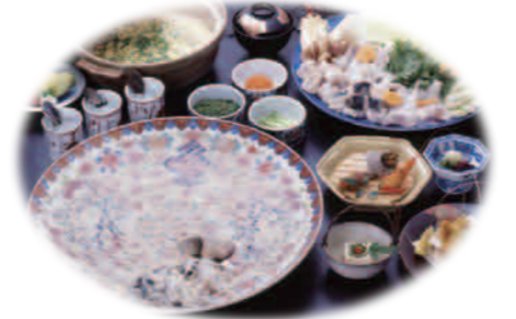
※画像は全てイメージです。