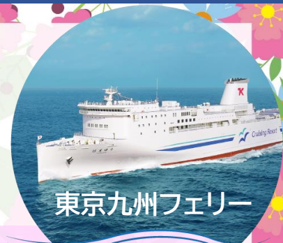
東京九州フェリー