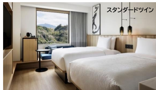
スタンダードツイン