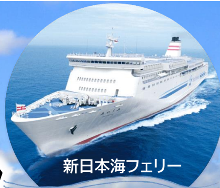
新日本海フェリー