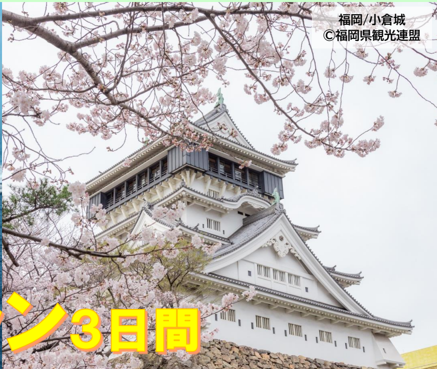
福岡/小倉城