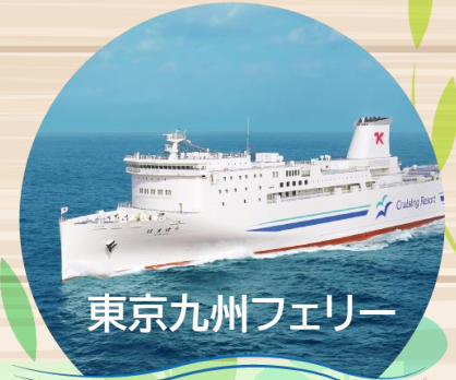
東京九州フェリー