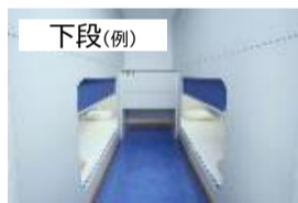
ツーリストA 2段ベッド相部屋