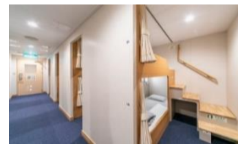
スタンダード洋室 2段ベッド相部屋