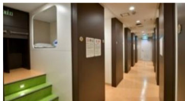
ツーリストA 2段ベッド相部屋