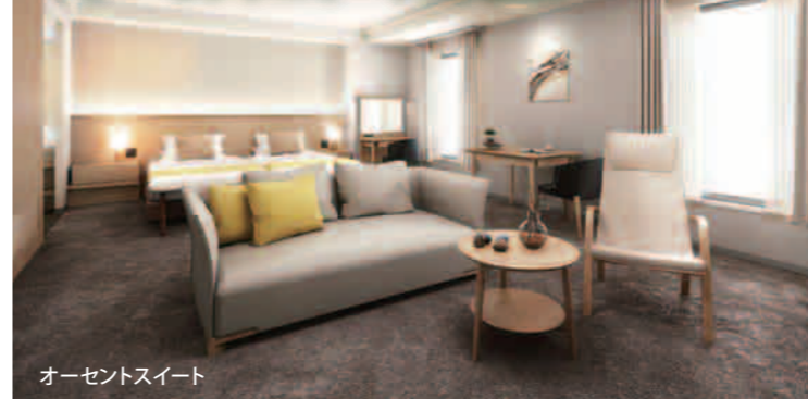
オーセントスイート