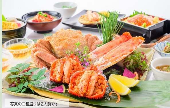
写真の三種盛りは2人前です

ツーリスト・ステートプラン共通のご案内 ※オーセントホテル小樽のご夕食は、ホテルレストランにてご用意致します。「17:30開始」と「19:30開始」の2回転となります。