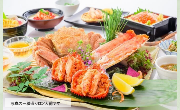
写真の三種盛りは2人前です

ツーリスト・ステートプラン共通のご案内 ※オーセントホテル小樽のご夕食は、小樽・苫小牧東港到着の翌日以降にホテルレストランにてご用意致します。