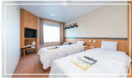
デラックス和洋室(2~3名)