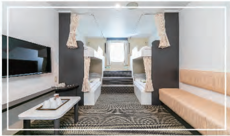
デラックス洋室(4名)