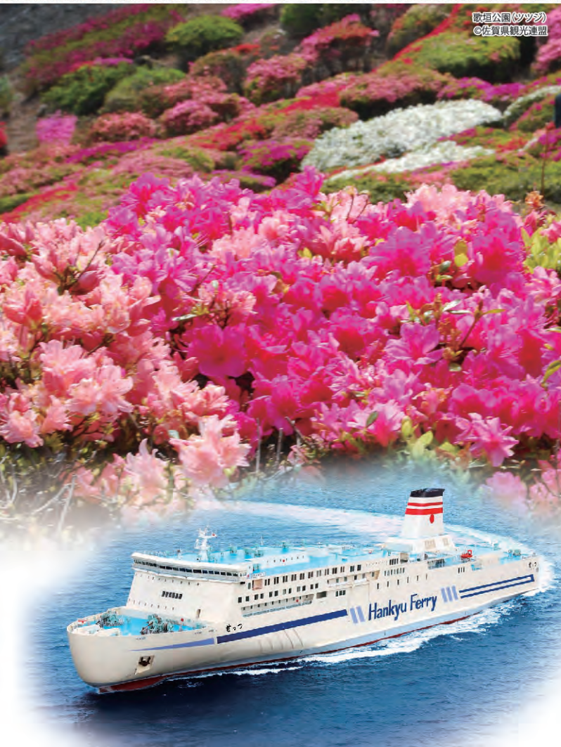
歌垣公園(ツツジ)