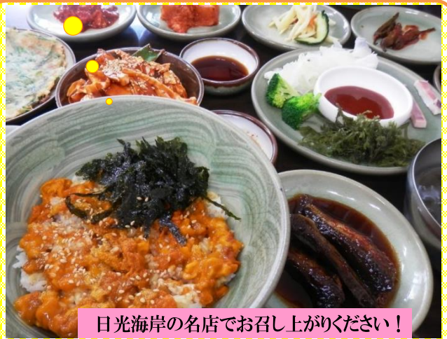
日光海岸の名店でお召し上がりください!

釜山最後の楽園ビーチ? “日光海岸” 鳥瞰写真 ちよっと懐かしい雰囲気の 海辺散策をお楽しみください!